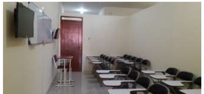
Kelas Program Perawat JUKU AH Nasution

Mempelajari bahasa Jepang tingkat Dasar I, dari segi tata bahasa, percakapan, latihan soal, pendengaran dsb.