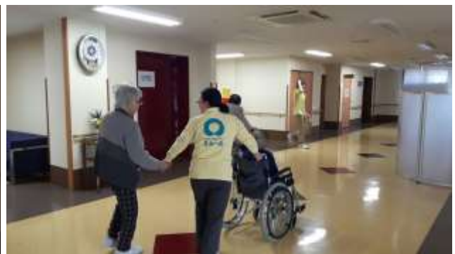
Senior Living di Jepang (salah satu lokasi kerja)