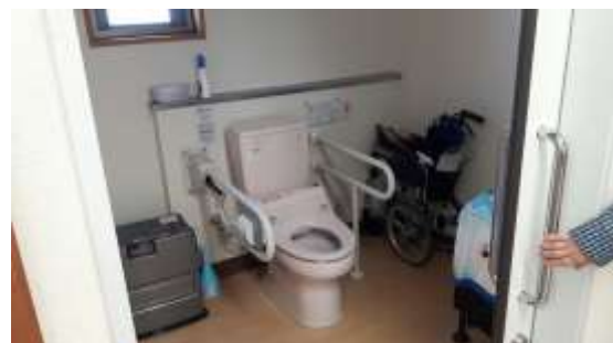
Fasilitas di Senior Living Jepang